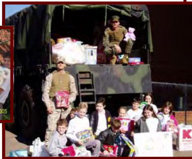
Los Juguetes para Tragos